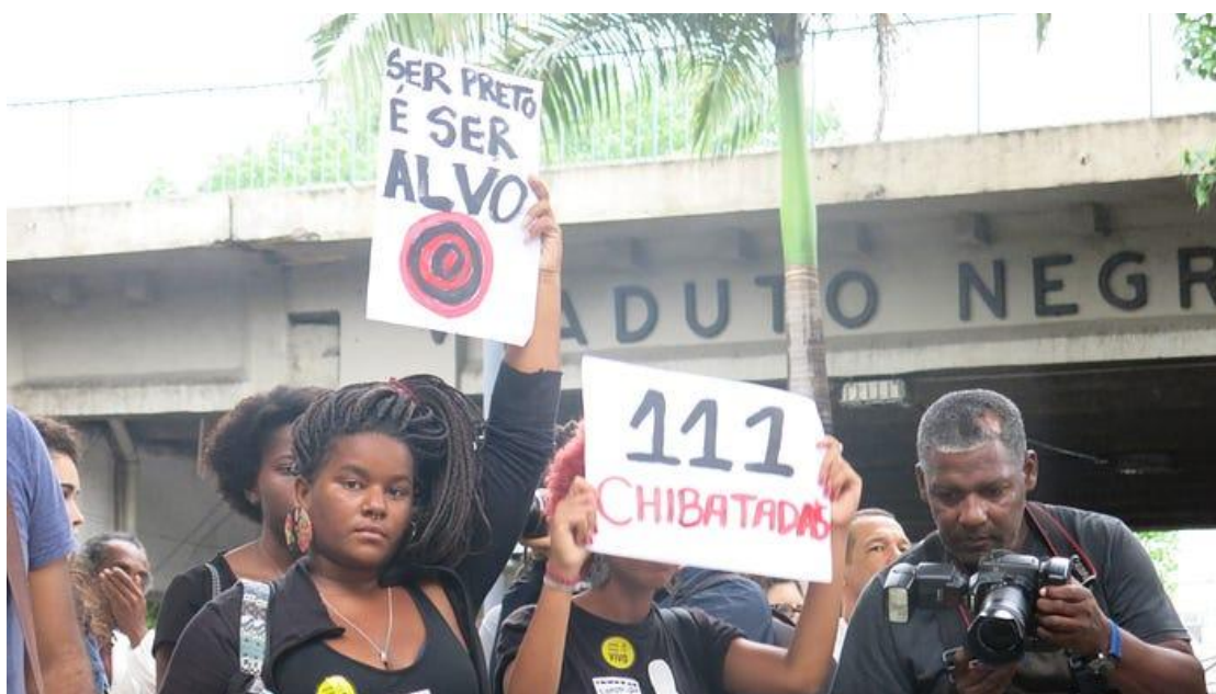
Ato em Madureira (03/12/15) chamou atenção para o genocídio da juventude negra no Rio.

A discussão sobre a militarização e os abusos da ação policial voltou à tona neste fim de ano após o assassinato de cinco jovens negros , metralhados por 111 tiros de pistola e fuzil dentro de um carro no bairro Costa Barros, na Zona Norte do Rio. Os jovens foram mortos quando voltavam para casa após um lanche. Eles comemoravam o primeiro salário da vida do mais novo deles: Robério de Souza Penha, de 16 anos.