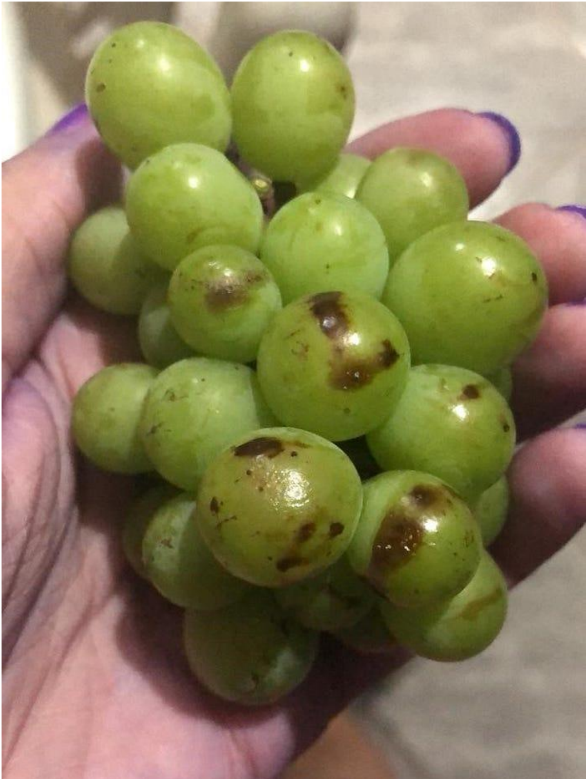
A poluição provocada pela Ternium contamina os alimentos e prejudica a saúde dos moradores de Santa Cruz

E não são os pescadores os únicos prejudicados. Diversas famílias da região, que cultivam frutas e hortaliças em seus quintais, sofrem com a poluição do ar provocada pela produção de aço. Ao ver a foto de um cacho de uva