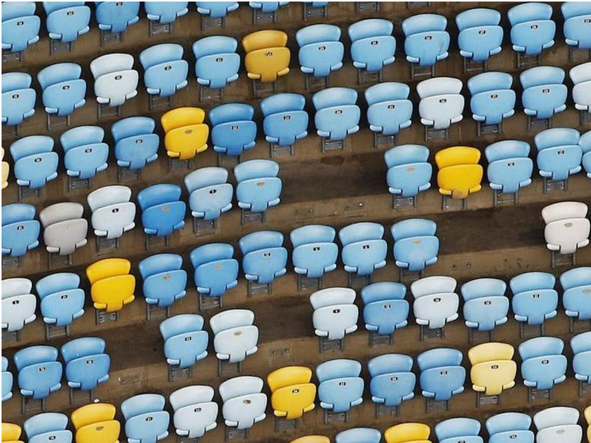
Faltam cadeiras no Maracanã