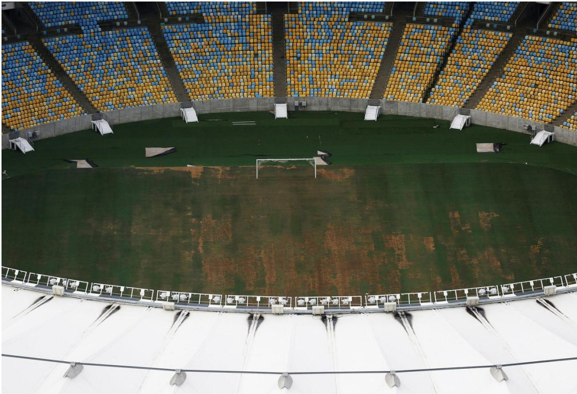
Maracanã, sede da abertura e encerramento dos Jogos com gramado carente de manutenção