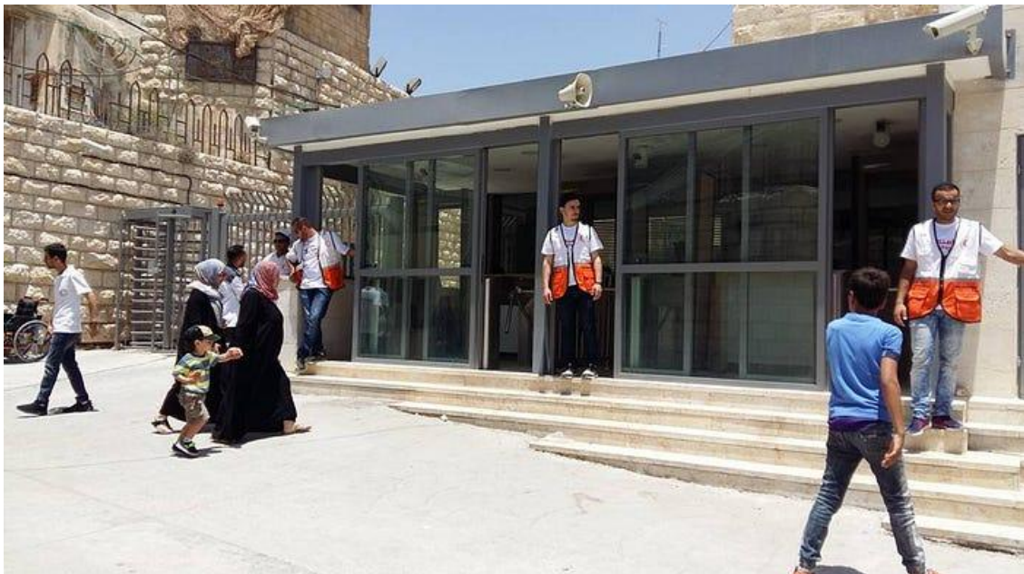
Rotina de passar pelo "check points" afeta a vida de crianças palestinas.

Uma das únicas escolas que funcionam no local, está cercada por muros, grades e arames farpados. Todos os dias, para as crianças chegarem à escola, elas precisam passar pelos checkpoints ( postos de verificação ). Todas as crianças são revistadas para entrarem e saírem das escolas. Segundo um morador, inclusive, soldados israelenses invadem constantemente a escola e levam crianças presas. Em Hebron, a militarização se faz presente controlando o comércio, a casa, a educação, a saúde, a vida de cada palestino e palestina que sobrevive ali.