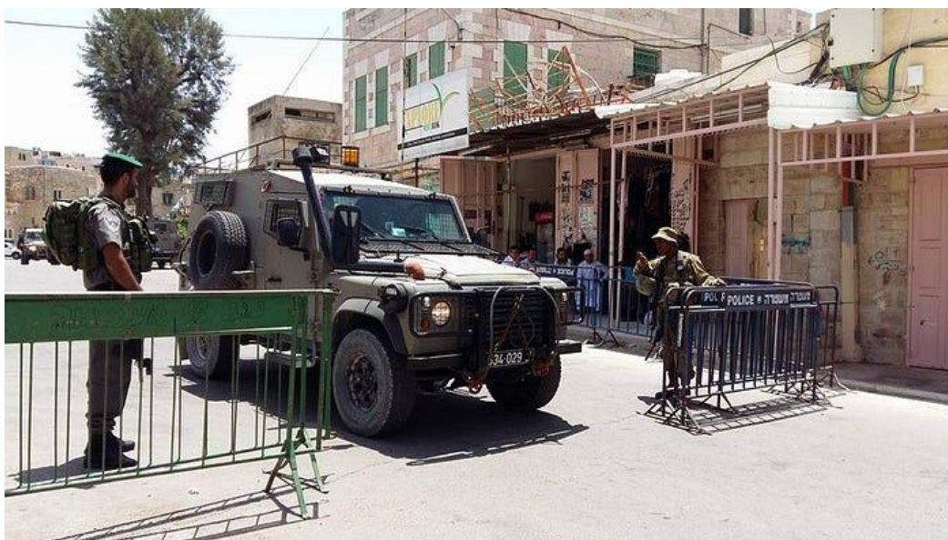
Check point em Hebron.

Hebron, cidade localizada no sul da Cisjordânia, luta contra a militarização, o fechamento do comércio, falta d'água e as constantes prisões. Realidade nada muito diferente das favelas do Rio de Janeiro.