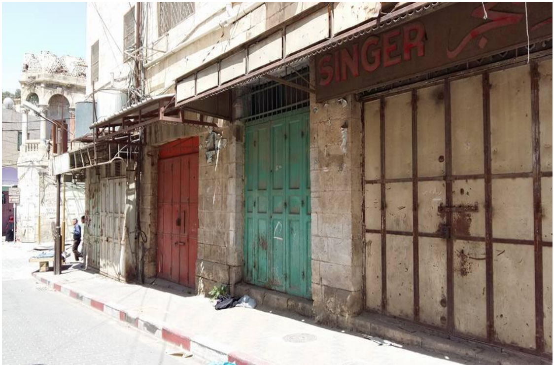
Conhecida pelo comércio, Hebron é hoje uma cidade de lojas fechadas, imposição da militarização.

Para além da falta de alternativas de trabalho e as grades pelas ruas que atingem aqueles moradores, outro problema é a falta d'água. Palestinos precisam percorrer pelo menos 6 km para conseguirem água, ao contrário