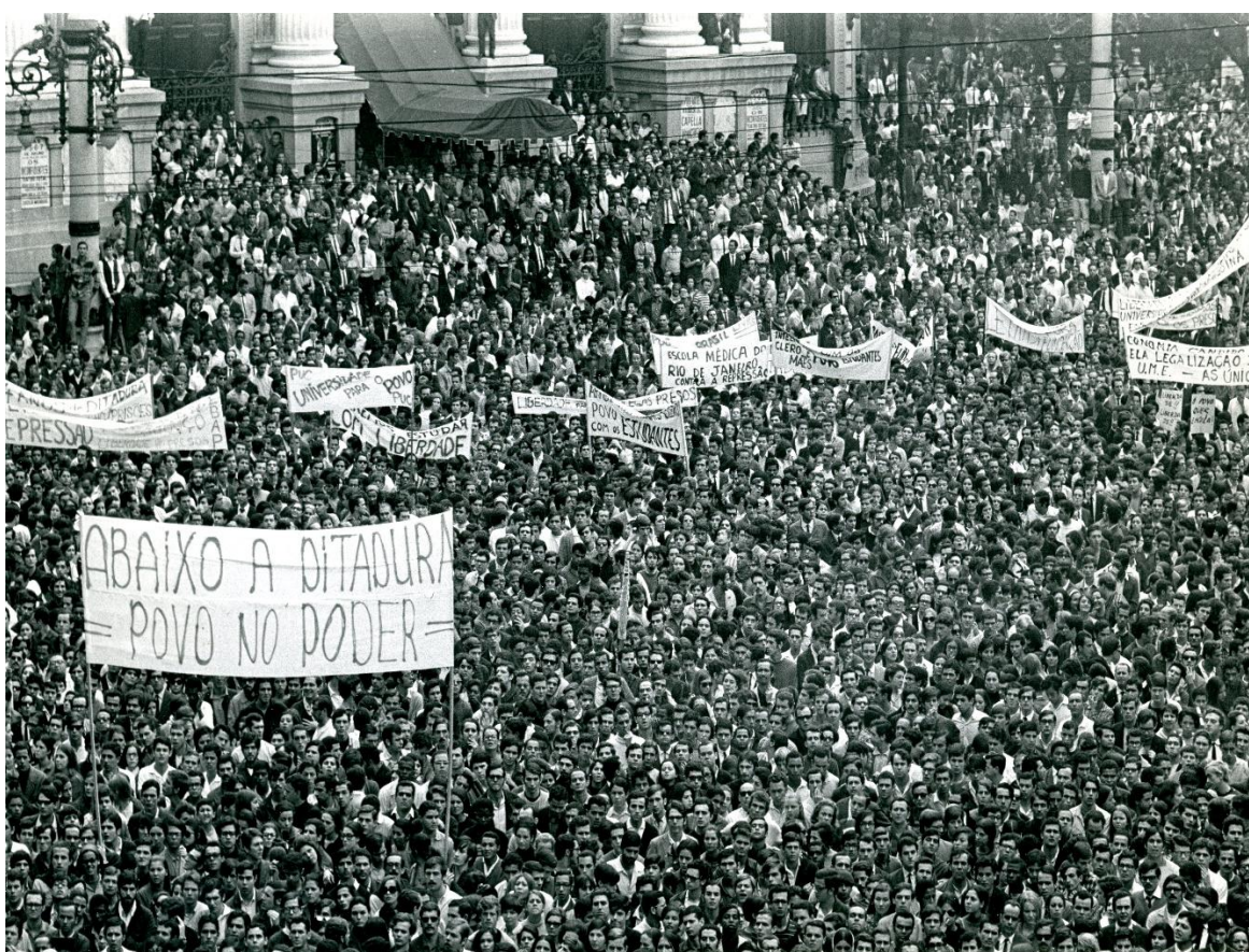
Foto clássica de Evandro Teixeira no dia da Passeata dos Cem Mil (1968). Durante os “Anos de Chumbo” se perpetuou a lógica do sistema da dívida: “quanto mais paga, mais deve”.

Autoria de Marcos Arruda / Instituto PACS