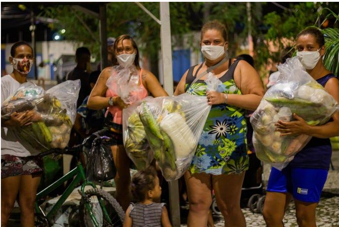
Ação coletiva com integrantes da Rede Tumulto, em Recife, Pernambuco

de ação naqueles locais, criando uma co-responsabilidade pela comunidade. Nós não queremos ser taxados como os jovens e pessoas que acessaram outra realidade e precisam ensinar algo para o público alvo, até porque já vivenciamos isso. Nós acreditamos em uma construção coletiva não romantizada, que as pessoas tem que se responsabilizar e fazer o seu próprio corre para ajudar a comunidade.