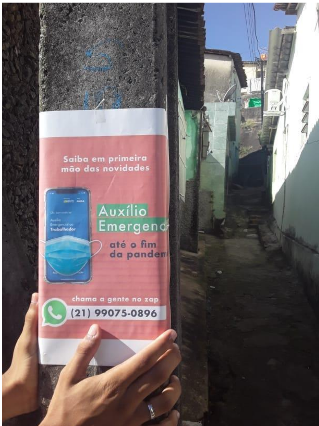
Ação coletiva com integrantes da Rede Tumulto, em Recife, Pernambuco