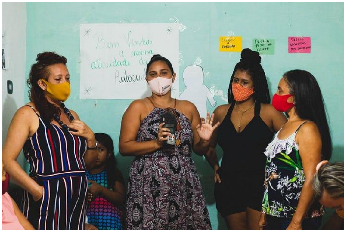
Ação coletiva com integrantes da Rede Tumulto, em Recife, Pernambuco

faxina diminui, a pressão da minha mãe sobe. Desde o início da pandemia até ontem segue sendo assim. É difícil não falar sobre outra coisa, combater as coisas... O impacto principal foi sobre a vida dessas mulheres que são donas de casa e isso nos fez entender que a escuta é um processo formativo para nós podermos dar o outro passo.