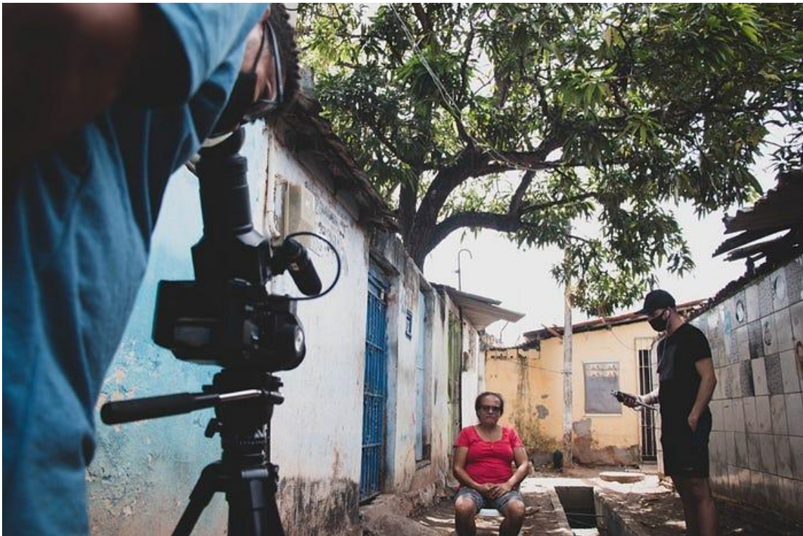
Ação coletiva com integrantes da Rede Tumulto, em Recife, Pernambuco

trabalharmos com as pessoas? A pandemia veio para mostrar que nós não temos ninguém pela gente, somos nós por nós como sempre foi.